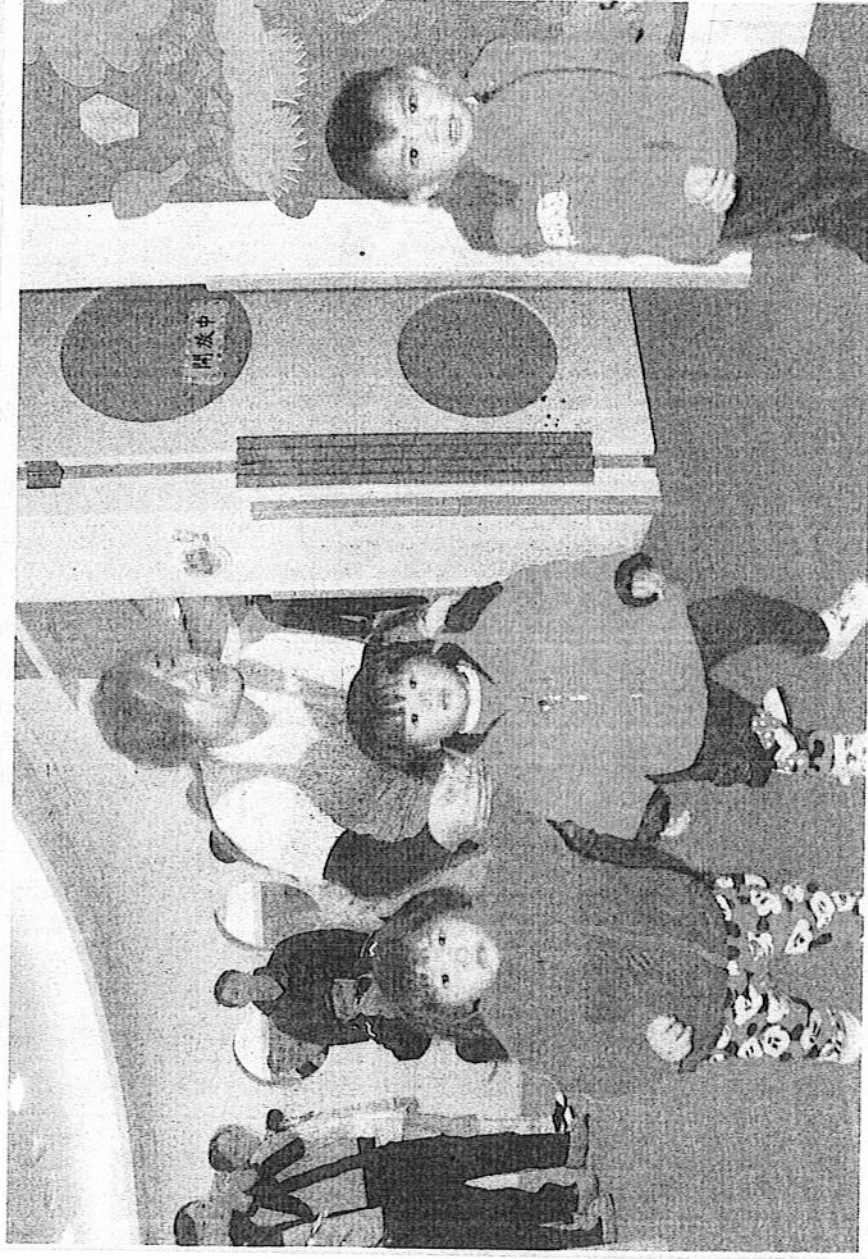
↑新莊裕民公托舉行消防演練，保育人員帶領小朋友緊急避難。