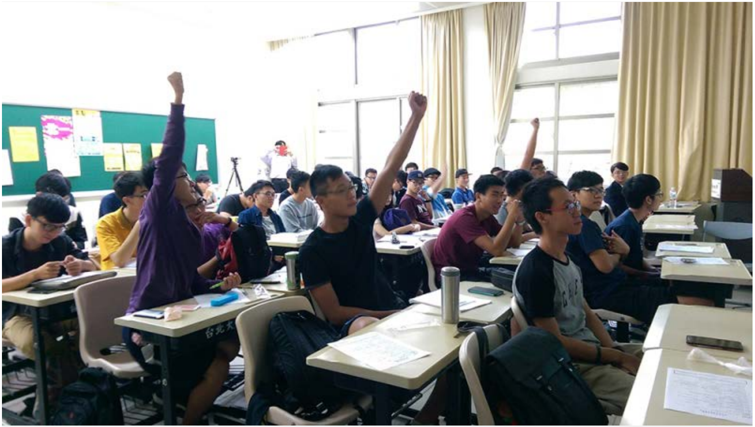
【▲租屋講座發問踴躍】