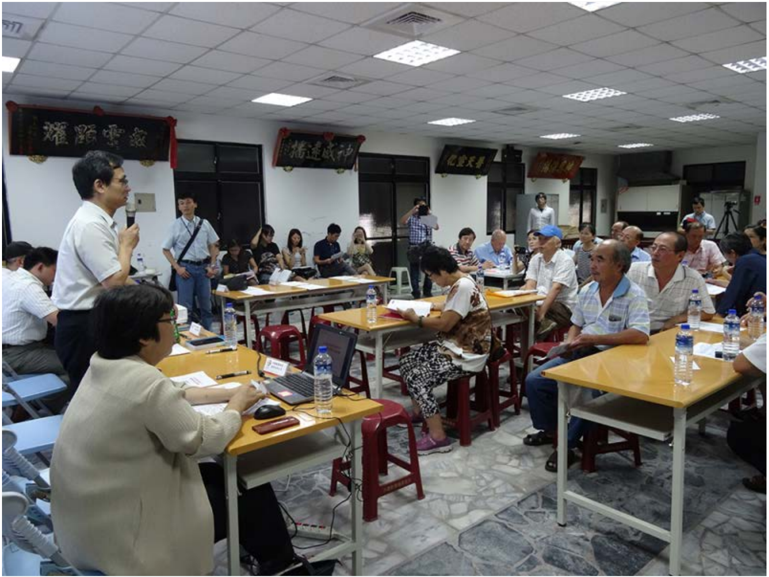
【▲淡海路案件市府人員及推動師與民眾討論情形】