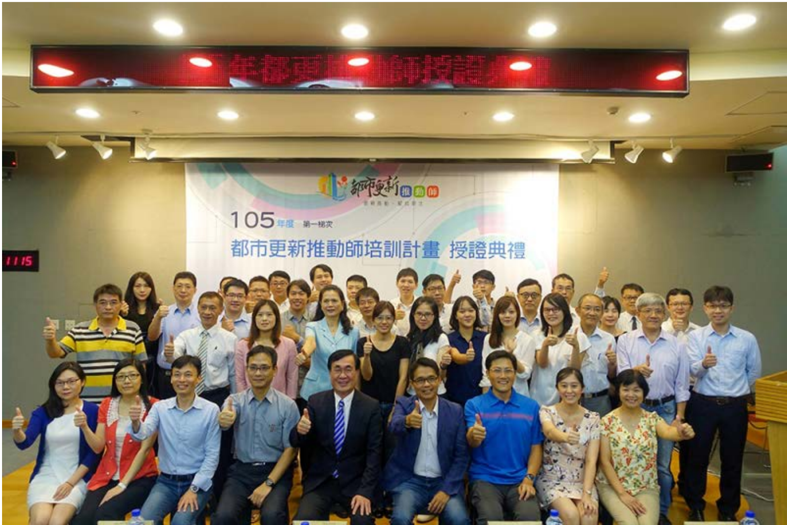
【▲105年第1梯次都市更新推動師授證典禮】