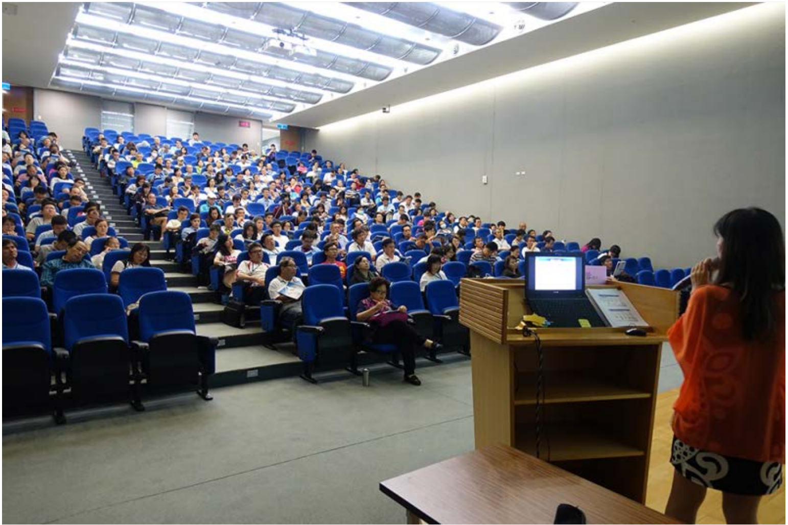
【▲105-1梯都更推動師受訓上課】