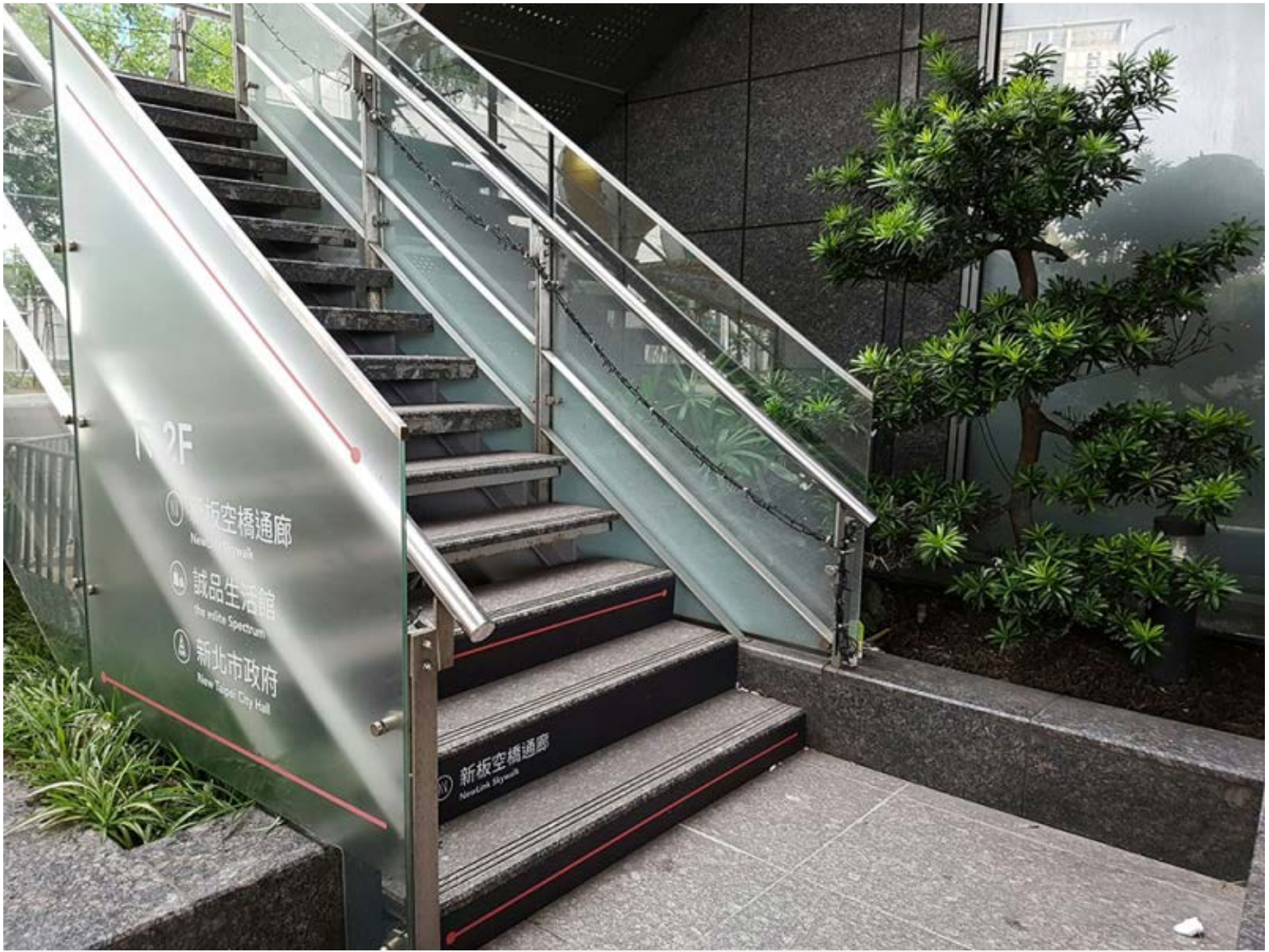
【▲階梯式指標(麗寶百貨)】