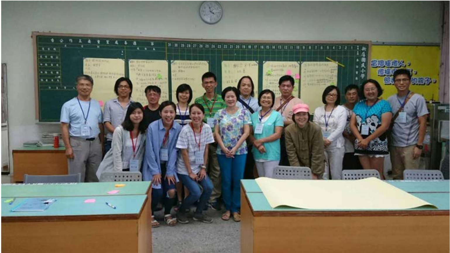
【▲大家的參與就是社區活化的動力】

邱局長說，社區朋友都是小客廳的主人，也歡迎經常作伙入來坐，大小朋友的每個空間活化好點子，都是相互交流的結晶，大家的參與就是社區活化的能量，也樂見更多參與持續發酵，成為永續經營的源動力。