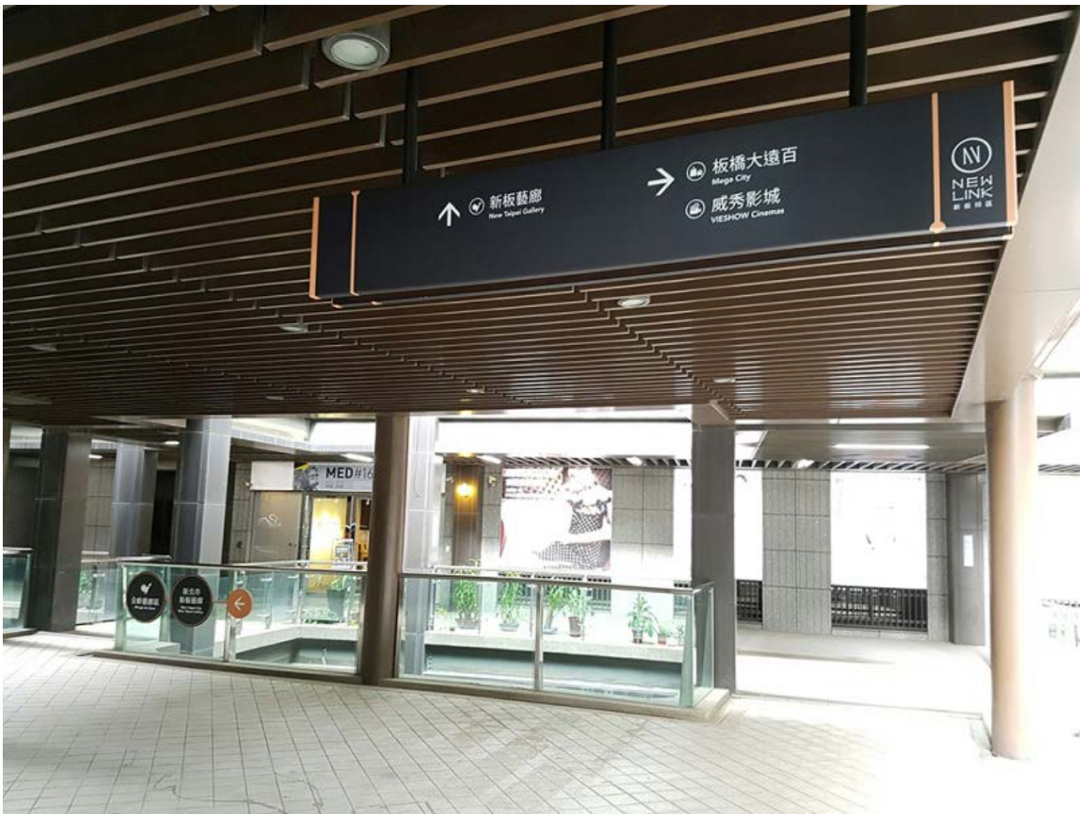
【▲懸吊式指標(新板藝廊)】

新北市政府在今年7月底開通了Mega City大遠百至橋峰大樓的空橋系統，完成新板特區東側立體連通系統路線，民眾可以從板橋車站通往公車站、麗寶百貨廣場、誠品書店、市府大樓、新板藝廊、大遠百、福德公園、婦女樂活館一直到體育場，在炎熱地夏天或下雨天，都有遮陽及避雨的人行空間，無論洽公、搭車、運動、休憩或購物都相當便利，歡迎大家多加利用。