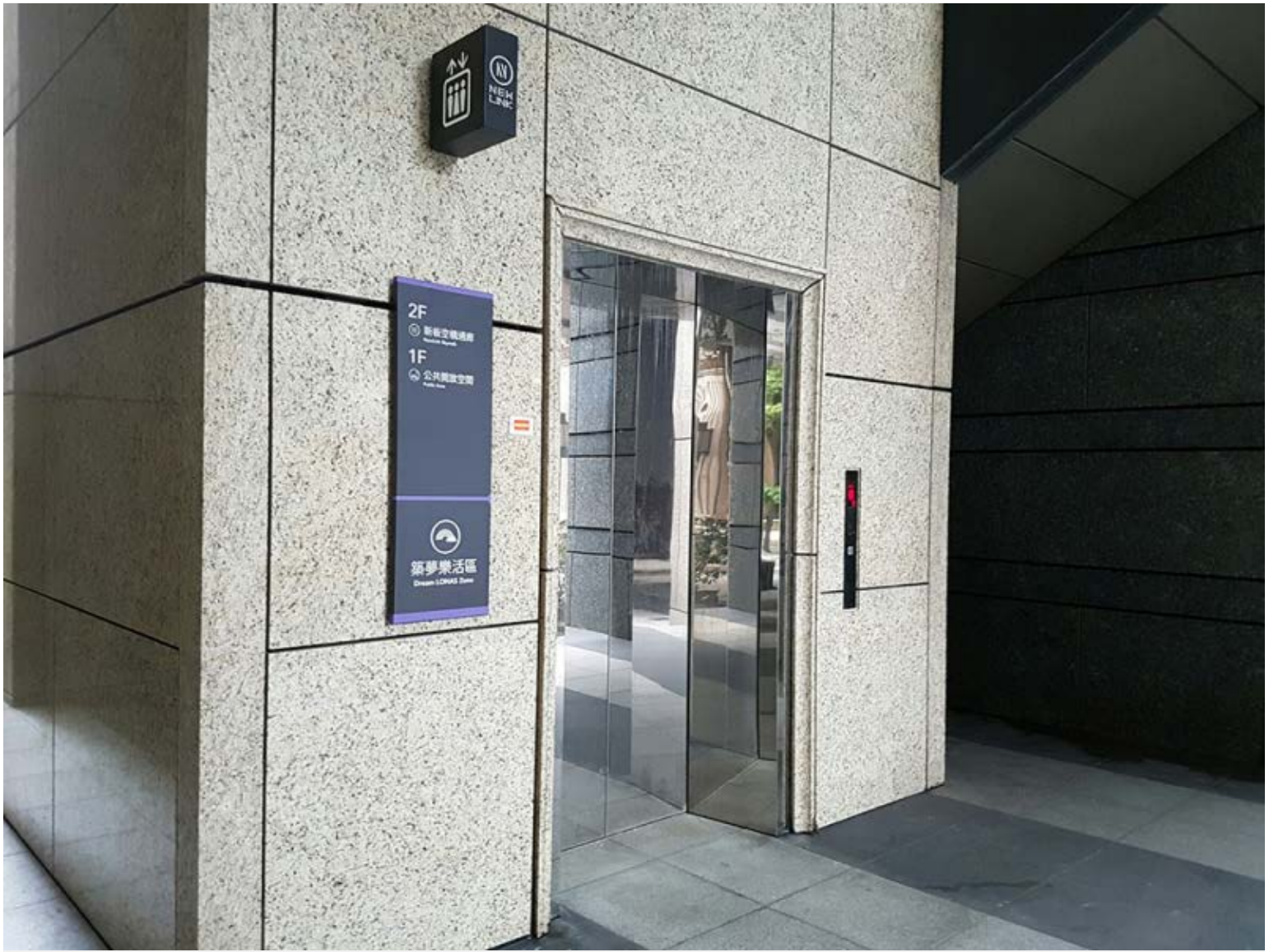
【▲貼壁式指標(厚生大樓)】