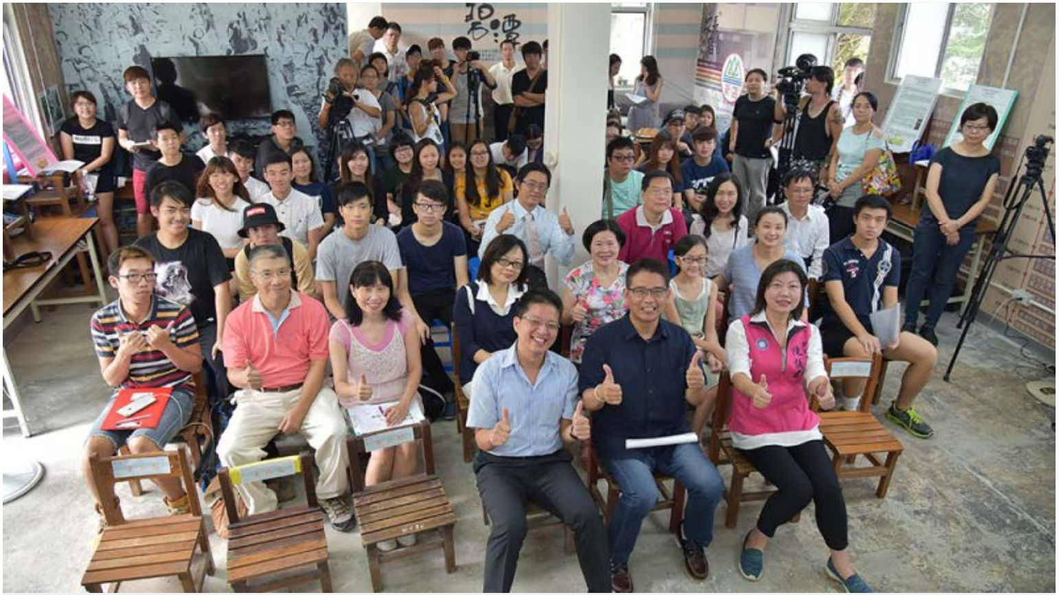
【▲國校小客廳歡迎作伙入來】