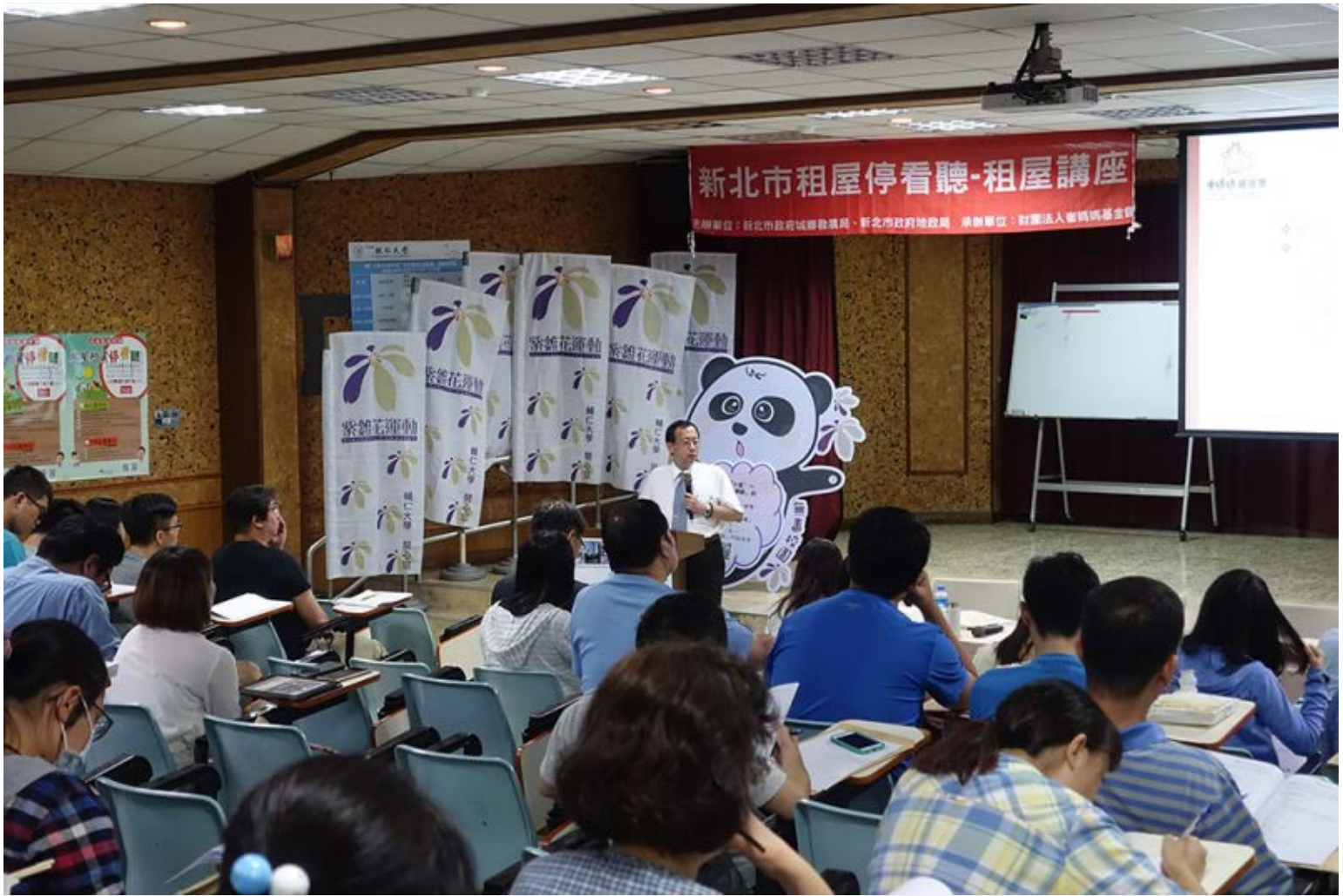
【▲輔仁大學租屋講座實況】