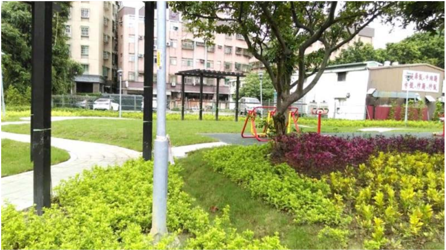
【▲鶯歌區二橋段綠家園基地】

本案綠家園基地是考量鶯歌區地方建議，配合現有道路動線，將地方上閒置已久的公有土地，以街角廣場花園的理念進行簡易綠美化，以打造轉角空間綠化的意象，使該地區成為轉角空間，成為社區活化再利用的新活動聚點，讓民眾攜老扶幼享受城市中難得的綠意。