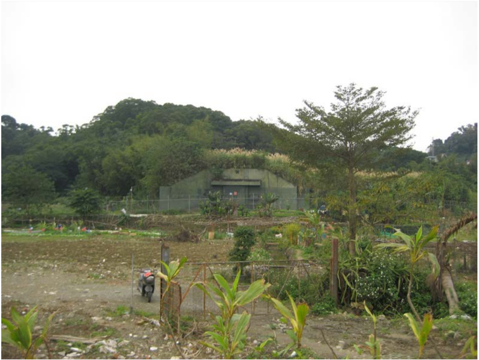
【▲灰磘地區解除軍事禁限建管制】