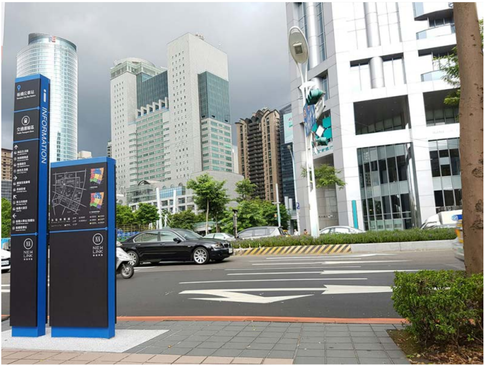
【▲立地式指標(板橋公車站)】