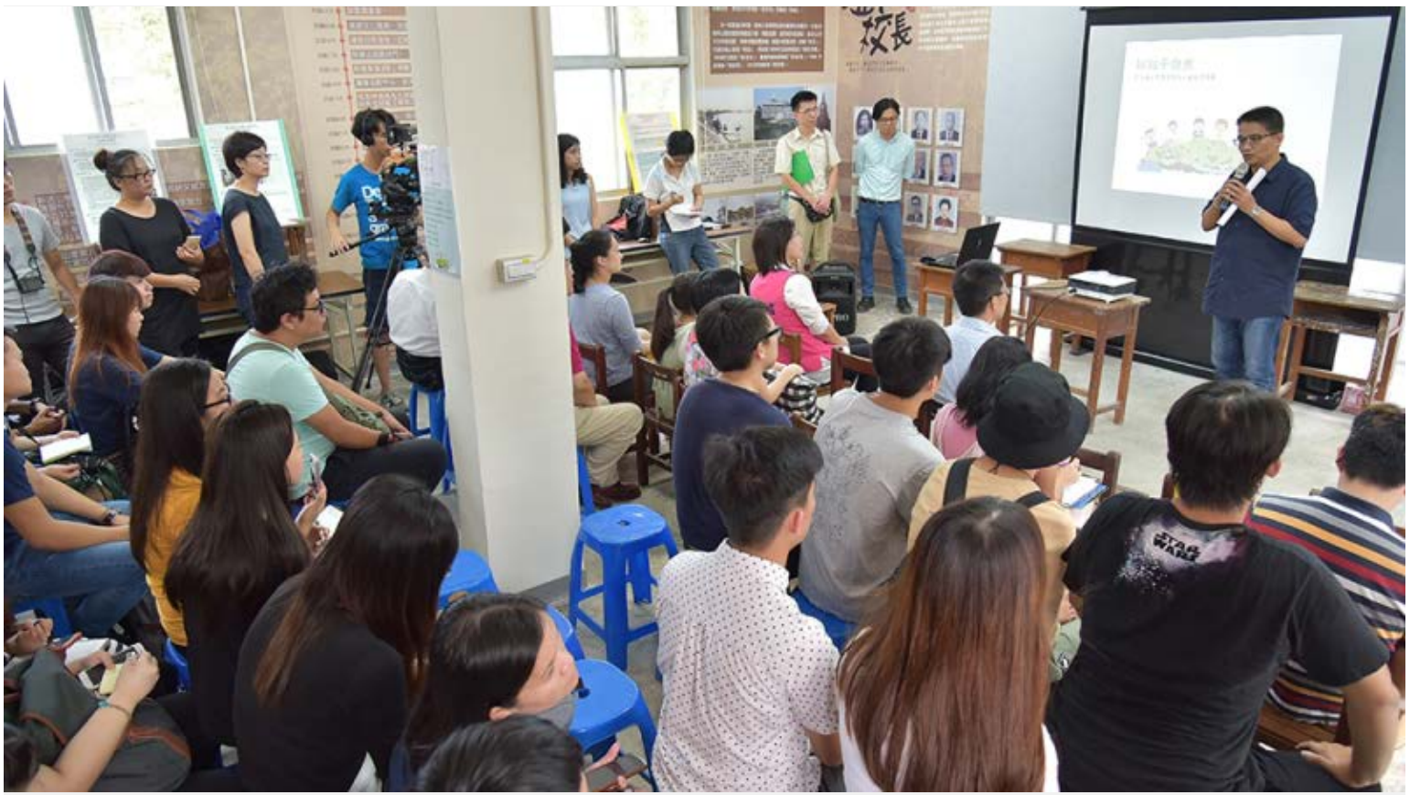
【▲邱局長感謝提案者及所有參與者】