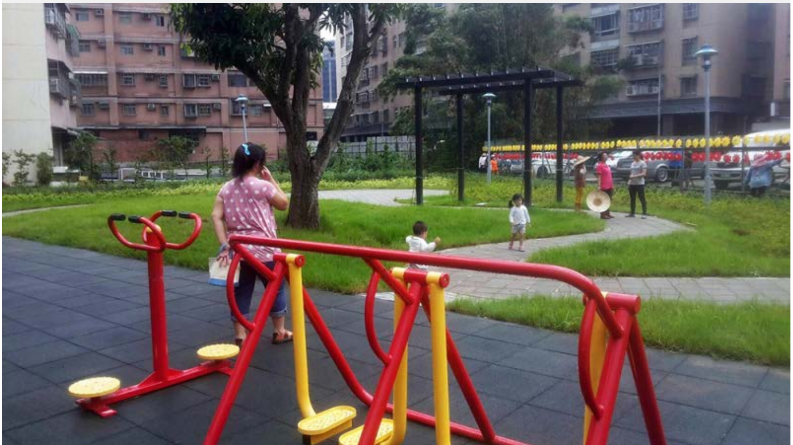
【▲閒置土地搖身成為綠意休憩空間】

本案綠家園基地是考量鶯歌區地方建議，配合現有道路動線，將地方上閒置已久的公有土地，以街角廣場花園的理念進行簡易綠美化，以打造轉角空間綠化的意象，使該地區成為轉角空間，成為社區活化再利用的新活動聚點，讓民眾攜老扶幼享受城市中難得的綠意。