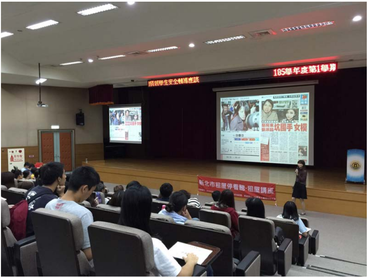
【▲宣導如何查詢土地使用分區】