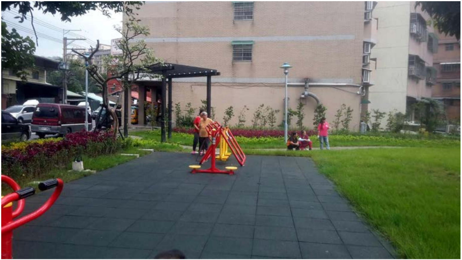
【▲二橋里社區增添一處社區活動新場所】