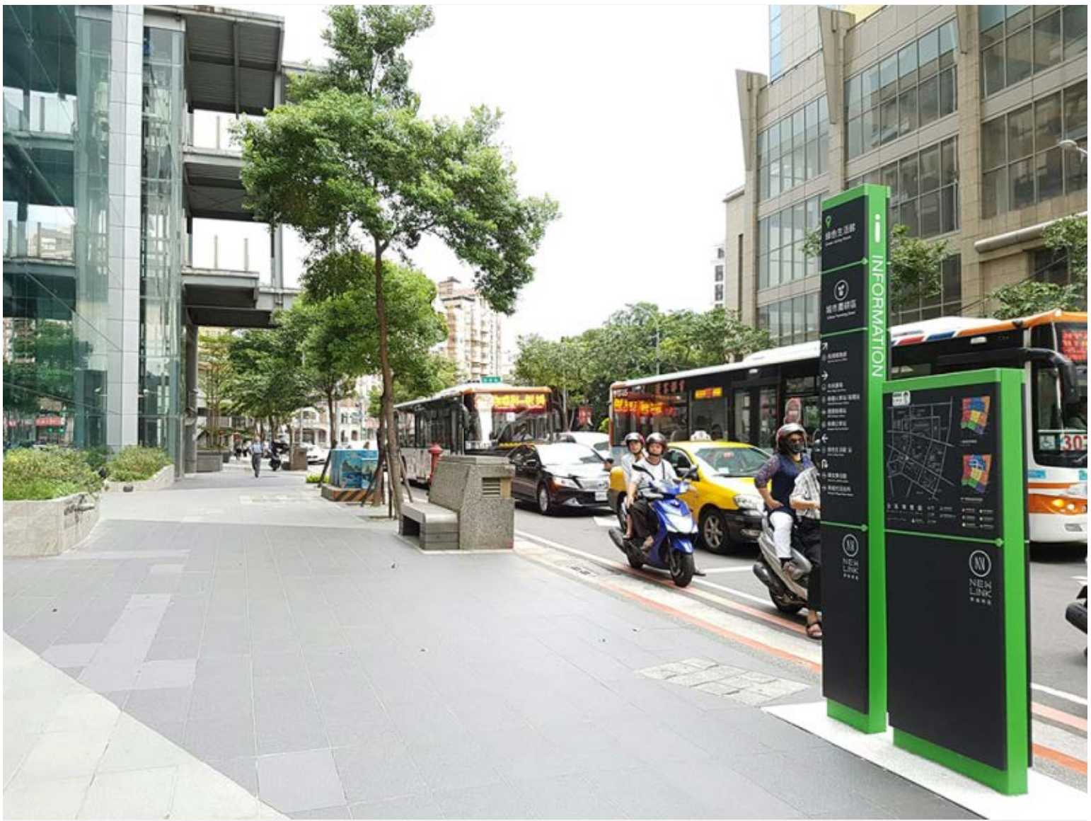
【▲立地式指標(新府路與中山路交叉口)】