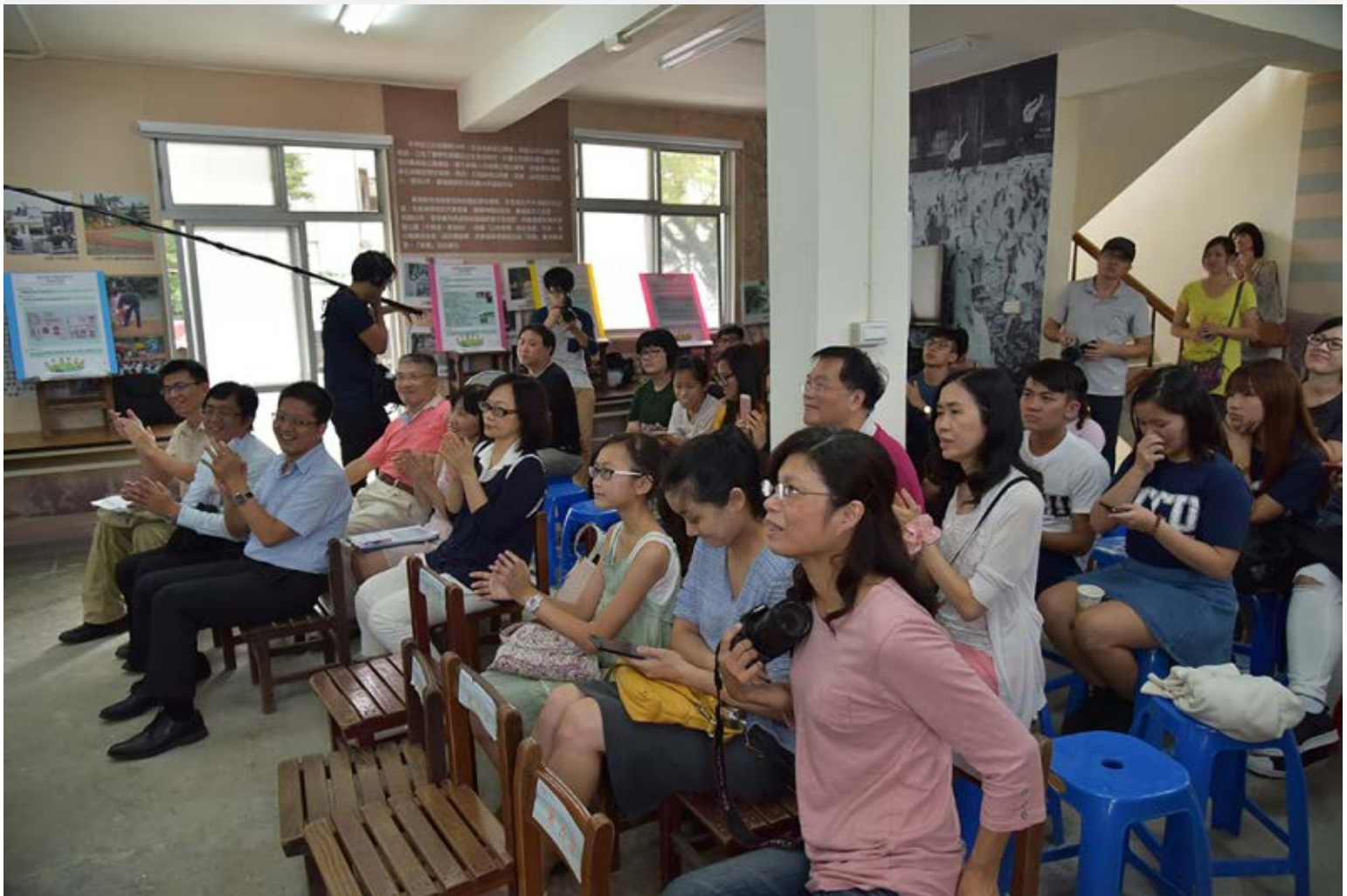
【▲社區伙伴們給提案者鼓勵也互相打氣】