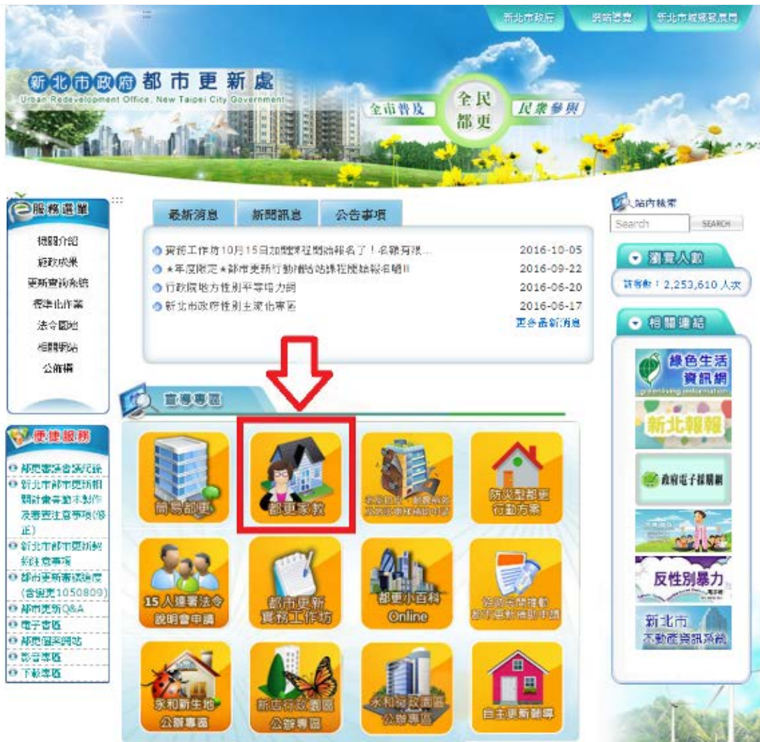
【▲新北市政府都市更新處網站示意圖】