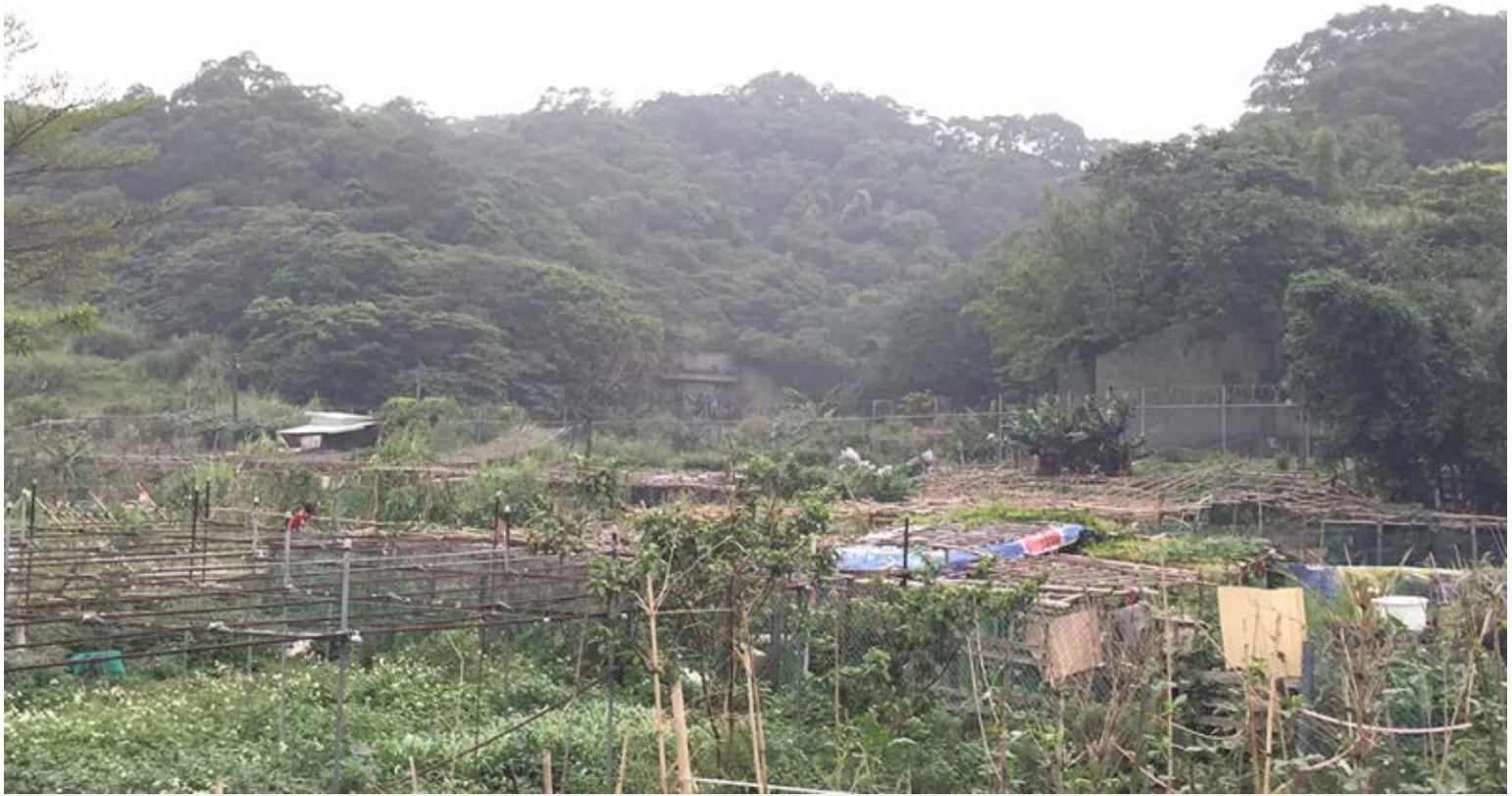
【▲灰磘地區現況土地利用效率低】